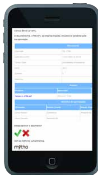
Fig. 2 – Aprovação de documentos via smartphone

Apoiado no motor de Base de Dados SQL, o Mytho Gestão Documental guarda os seus documentos directamente na Base de Dados, evitando que os ficheiros possam ser acidentalmente apagados. Através dos planos de manutenção do SQL os backups da sua informação são garantidos de forma simples e intuitiva para o IT da sua empresa.